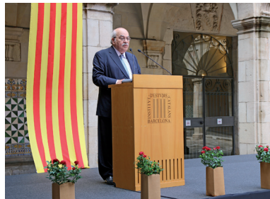
FOTOGRAFIA 1. El membre de l'IEC Andreu Mas-Colell pronunciant el discurs patriòtic.